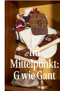
Im Mittelpunkt: G wie Gant

Eine Neuausführung unserer geliebten Harrington Jacket aus Cord. Die zweite Überraschung? Das unglaublich tolle karierte Futter. Der klassische Stehkragen und die schrägen Pattentaschen machen diese Jacke zur perfekten Preppy-Wahl.