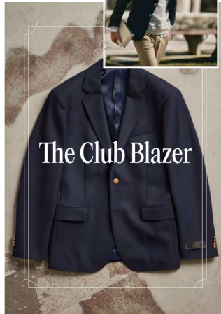
The Club Blazer

Doch in keinem Sakko-Himmel darf der Club Blazer fehlen! Mit einer Geschichte, die bis ins 19. Jahrhundert zurückreicht, hat sich dieses ikonische Stück von einer funktionellen Ruderjacke zu einem Symbol für zeitlose Eleganz entwickelt. Natürlich wollen wir diesen Juwelen auch in unserer Sakko-Sammlung! Die Reise, die der Club Blazer zurückgelegt hat, zeugt von seiner währenden Attraktivität und unübertroffenen Vielseitigkeit.