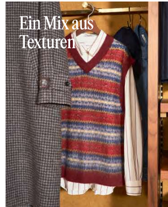
Ein Mix aus Texturen